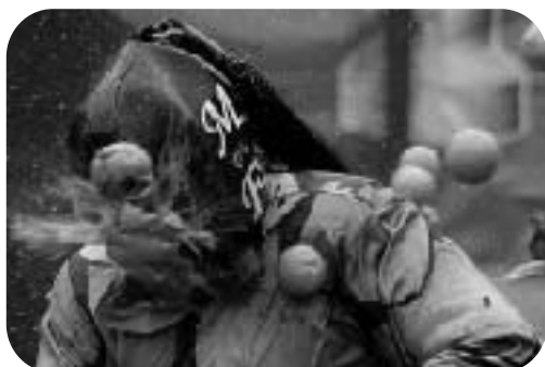
▲オレンジで兵士の顔を射止めた瞬間

写真の真ん中に、兵士の馬車。その後ろに、オレンジの箱があります。またその後ろに観客がいます。兵士は無地の上着、暴徒は格子縞の上着を着ています。もちろん、みんな馬を守るように協力します。